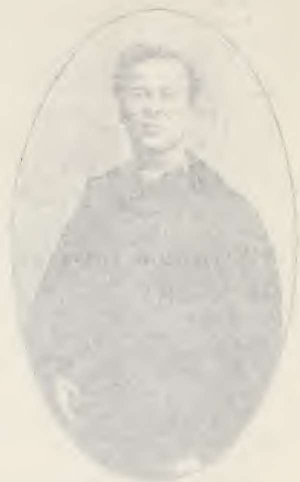
MR. J. W. [Name] [Address]